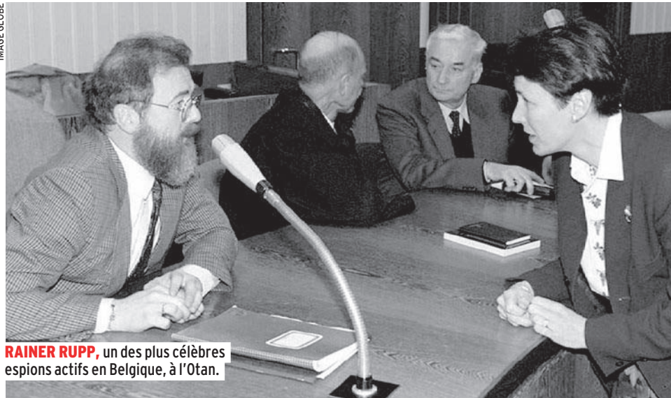
RAINER RUPP , un des plus célèbres espions actifs en Belgique, à l'Otan.

Le Hongrois Marton Szezsödi a été un des premiers espions du bloc de l'Est à être actif au cœur de l'Europe. Il était chargé de collecter des informations qui permettraient de renforcer la position de négociation de Budapest : la Hongrie fournissait en effet des produits agricoles à ce qui était alors la Communauté économique européenne. Parallèlement aux renseignements militaires et politiques, l'espionnage économique était également florissant. A en croire un document de la Defense Intelligence Agency américaine, l'espionnage économique était même la préoccupation majeure du KGB dans les années 1980 : « Le vol et la contrebande d'équipements et de technologies sous embargo Cocom (NDLR : qui devait empêcher toute exportation de technologies occidentales vers le Bloc de l'Est) sont devenus la priorité des services secrets de l'Union soviétique et des autres pays membres du Pacte de Varsovie. »