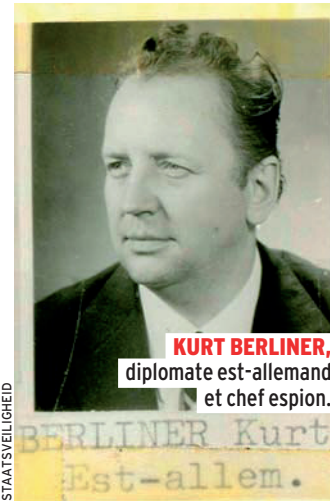
KURT BERLINER , diplomate est-allemand et chef espion.

recueil des données (MRD). Depuis, la Sûreté de l'État et le SGRS peuvent utiliser des modes de renseignements particuliers : écoutes téléphoniques, installation de micros, création de fausses entreprises, interception d'e-mails, violation du courrier... Cela rend plus efficace le contrôle exercé sur les services secrets étrangers. En 2011, le SGRS a fait appel à 54 reprises à ces nouvelles facultés en vue de trouver la trace d'espions étrangers. Contre 193 cas à la Sûreté de l'État.