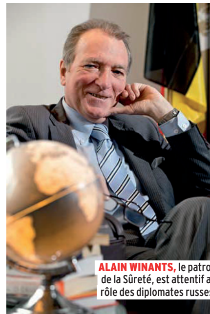
ALAIN WINANTS , le patron de la Sûreté, est attentif au rôle des diplomates russes.

Et le contre-espionnage belge ? Ces dernières années, la Sûreté de l'État et le SGRS ont obtenu un surcroît de personnel et de moyens. Chacun des deux services de renseignement compte actuellement quelque 650 collaborateurs. La lutte contre l'espionnage n'est évidemment qu'une de leurs missions. Le 1 er septembre 2010 est entrée en vigueur la loi sur les méthodes de