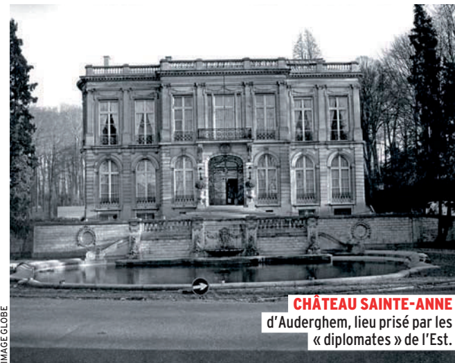
CHÂTEAU SAINTE-ANNE d'Auderghem, lieu prisé par les « diplomates » de l'Est.