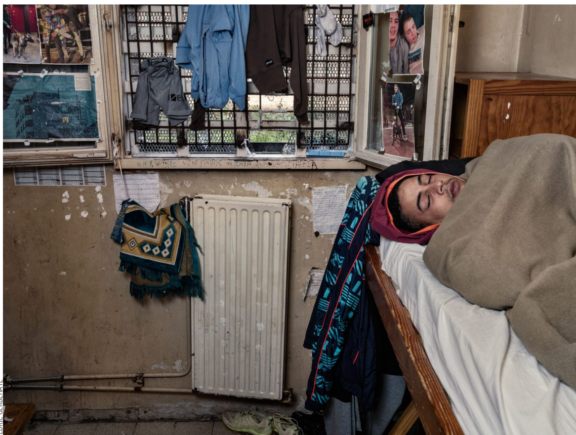
Une des cellules de la prison de Saint-Gilles.

→ Visite en présence de l’artiste les dimanches 19.04 et 17.05 à 11h.